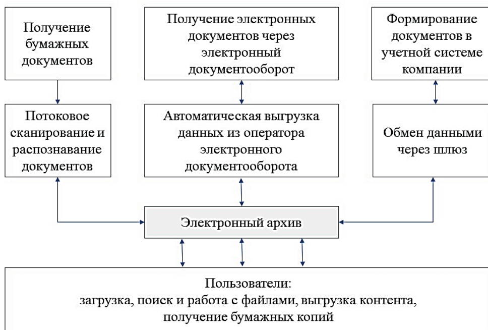
Рис. 1. Принципиальная схема наполнения единого электронного архива строительной компании

странство, для пользователей и процессов. Знания эти необходимы компании для обеспечения конкурентных преимуществ, повышения эффективности всех бизнес-процессов, повышения гибкости управления и кастомизации работы в случае конкретных сделок [1, 2].