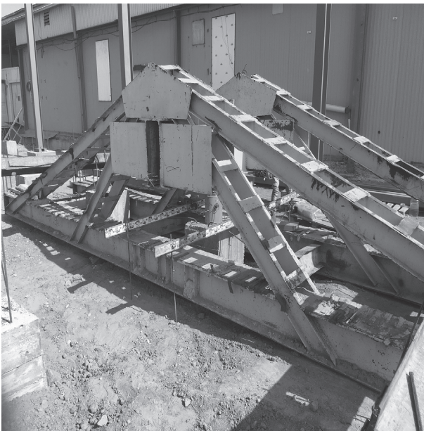
Рис. 2. Общий вид испытательного стенда

насосную станцию марки НРГ-7160 и гидравлический домкрат марки ДГ200П150 грузоподъемностью до 200,0 тс (рис. 2). Контроль за величиной давления в системе выполнялся при помощи манометра с ценой деления 10,0 бар. В качестве опорной конструкции, воспринимающей вертикальную нагрузку отпора, применен испытательный стенд в виде стальной фермы, закрепленной к анкерным сваям. Для наблюдения за ходом развития осадок опытных свай использовалась реперная система с прогибомерами с ценой деления 0,1 мм. Принимая во внимание инженерно-геологические особенности площадки строительства, а также требования п. 6.8 ГОСТ 5686-2012, выполнялось замачивание основания свай. Данная процедура проводилась перед началом статического испытания и продолжалась вплоть до окончания последних. Замачивание грунта выполнялось через специальные траншеи, заполненные щебнем, устраиваемые по периметру испытываемой сваи на расстоянии 1,0 м от боковой поверхности.