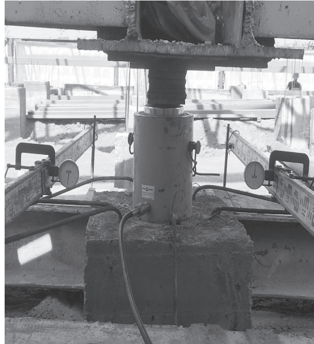
Рис. 3. Установка гидравлического домкрата и реперной системы

Переход к следующему этапу нагружения осуществлялся при достижении условной стабилизации перемещения сваи, при которой её осадка за отведенный интервал наблюдений не превышала 0,1 мм [5]. В целях доведения опытных свай до «срыва» допускалась передача дополнительной нагрузки.